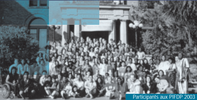
Participants aux PIFDP 2003

Fondée en 1967, la Fondation canadienne des droits de la personne est une organisation non gouvernementale à but non lucratif œuvrant dans l'éducation en droits de la personne au Canada et à travers le monde.