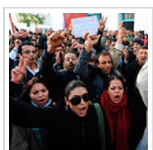
Sit-in des enseignants devant le ministère de l'Education: Des arrestations opérées