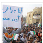
La contestation prête à reprendre n'importe quand dans le Sud de l'Algérie