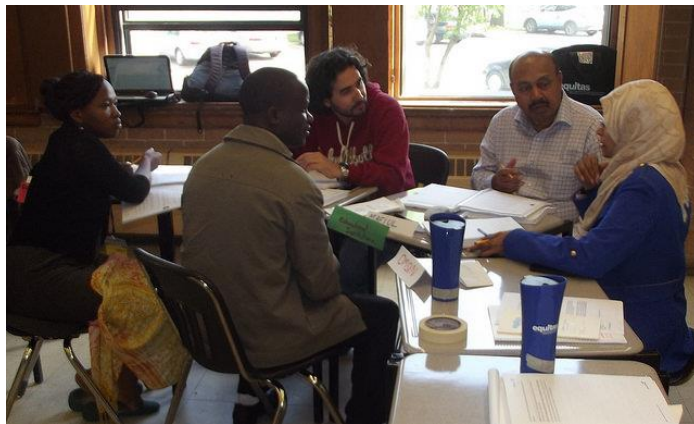
PHOTO: Discussion entre les participantes et participants du PIFDH 2014