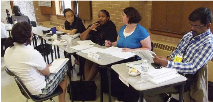
PHOTO: Des participantes et participants du PIFDH 2014 travaillant sur leurs Plans individuels

Des coaches et des facilitateurs de l'équipe pédagogique ont accompagné les participants dans l'élaboration de leurs plans individuels et un système de notation a été établi afin de juger de la qualité des plans développés. Selon les cinq (5) critères qui ont été retenus, les plans individuels doivent (1) intégrer les éléments de contenu de la SRFDH de manière pertinente, (2) inclure une approche participative, (3) intégrer une perspective tenant compte des différences entre les femmes et les hommes, (4) définir clairement un processus pour évaluer les résultats.