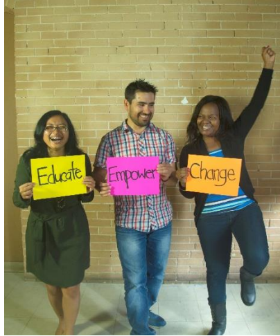
PHOTO: Participantes et participants du PIFDH 2014