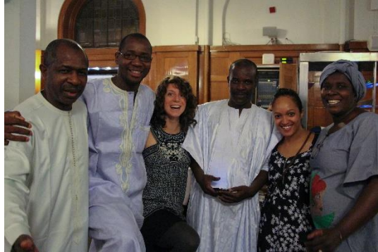
PHOTO: Participantes et participants du PIFDH 2014 avec le personnel d'Equitas