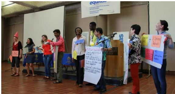
Participantes et participants du PIFDH 2014 présentant la Convention relative aux droits de l'enfant

Pour la première fois, Equitas a utilisé Survey Monkey ( www.surveymonkey.com ) pour centraliser tous les questionnaires d'évaluation.