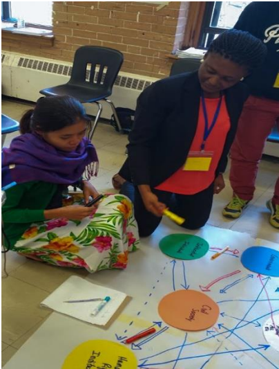
PHOTO: Des participantes du PIFDH 2014 travaillant ensemble sur une activité. Le partage d'expériences et la réflexion critique sont des éléments clés de l'approche participative du PIFDH.

On définit généralement l'ÉDH comme étant tout apprentissage qui : 1) renforce les connaissances; 2) développe les habiletés, et 3) les attitudes et les comportements en ligne avec les valeurs et principes des droits humains. Une approche participative est un élément clé de ce processus d'apprentissage et les participantes et participants rapportent constamment qu'il s'agit de l'une des plus grandes contributions du PIFDH à leur travail. En plus d'avoir cité l'approche participative comme l'apprentissage le plus important (48% des répondantes et répondants), trente-deux (32) participantes et participants (soit 43% des répondantes et répondants) ont également mentionné l'approche participative comme « l'élément le plus utile » du PIFDH pour leur travail.