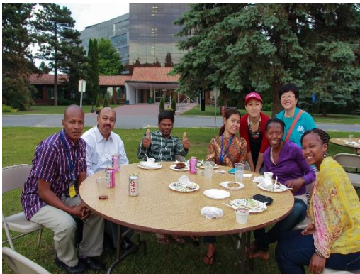
PHOTO: Participantes et participants du PIFDH 2014