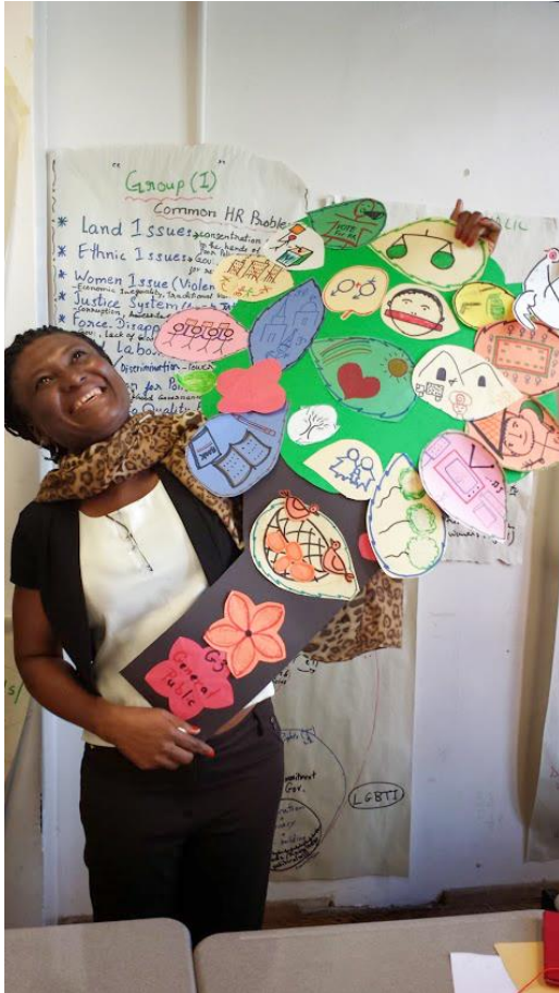
PHOTO: Une participante montrant la branche de l'arbre de la culture des droits humains réalisée par son groupe