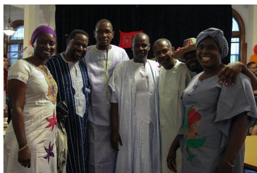
PHOTO: Participantes et participants du PIFDH 2014

Le Programme de cette année a rassemblé quatre-vingt deux (82) participantes et participants, y compris la venue de 5 anciennes participantes et anciens participants en tant que co-animatrices et co-animateurs. 50 pays ont été représentés et parmi le nombre total de participants, cinquante-huit (58) étaient anglophones et vingt-quatre (24) étaient francophones. Ces participantes et participants représentaient des organisations de la société civile, des organisations internationales, ainsi que des établissements d'éducation œuvrant dans le domaine des droits humains. Le Tableau 1 (ci-dessous) indique la répartition des participantes et participants par région et selon le sexe.