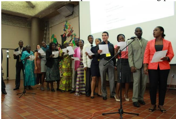
PHOTO: Les participants du PIFDH 2014 présentant leur exercice sur « Plaidoyer créatif au moyen d'une chanson »

Les commentaires des coachs, membres du personnel d'Equitas, ont indiqué une certaine incompréhension à propos de ce qui était attendu de la part des participants dans leurs réponses à certaines questions dans le cahier d'exercices. Il est recommandé de consacrer davantage de temps à la vérification approfondie de l'ensemble du cahier d'exercices avec les coachs avant le PIFDH et dans le cadre des sessions préparatoires de coaching pendant programme.